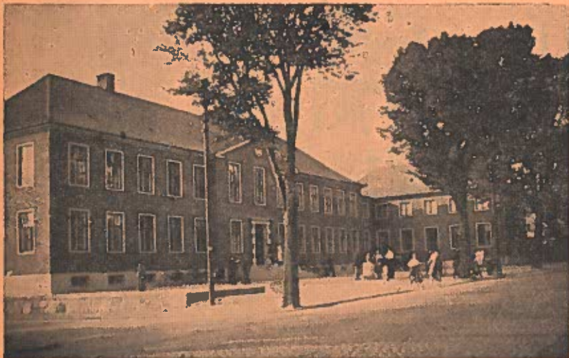
Høje-Taastrup Kommunes Raadhus i Taastrup.

Forgæves hæver langt bag Hjemmets Hegne sig højere mod Himlen Jordens Bryst! o, hvad var Himlen selv, hvis ingen Vegne vort Hjerte det fandt Spot af svunden Lyst? Jens Baggesen.