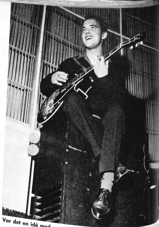
Var det en idé med en guitar?